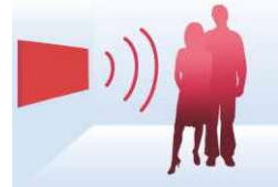
Effiziente Temperaturverteilung bei Einsatz einer Infrarotheizung.