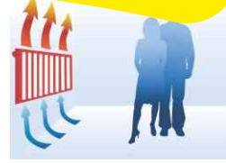
Ineffiziente Temperaturverteilung bei Einsatz einer Konvektionsheizung.

Eine Infrarotheizung hingegen erwärmt nicht die Luft, sondern die Wände sowie sämtliche im Raum befindlichen Gegenstände. Die gespeicherte Wärmestrahlung wird danach gleichmäßig abgestrahlt. Es handelt sich dabei um einen völlig natürlichen Vorgang, gleich einem Kachelofen bzw. der Sonne. Diese sanfte Strahlung wirkt angenehm und spart Heizkosten. Die Raumtemperatur wird gegenüber einer Konvektionsheizung bis zu 2-3°C wärmer empfunden.